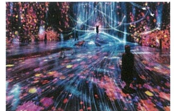
teamLab Borderless: MORI Building DIGITAL ART MUSEUM