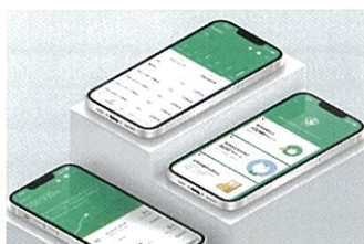
りそなグループアプリ