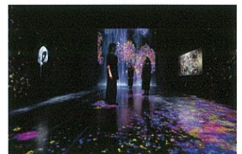
Future World: Where Art Meets Science