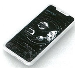
BUMP OF CHICKEN リスナー向け公式アプリ