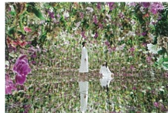
teamLab Planets TOKYO DMM