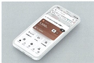
三井ショッピングパークアプリ